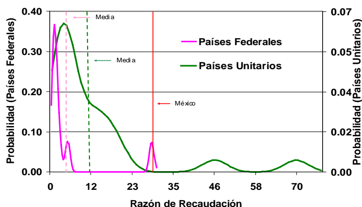
Razón de la Recaudación Federal o Central entre la Suma de la Recaudación Estatal y Local, 2000